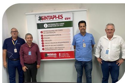
Atendimento do Sintapi/ES, na Samarco

Essas parcerias reforçam o compromisso do Sintapi-ES em garantir suporte técnico e orientação previdenciária a uma ampla gama de trabalhadores, promovendo acesso a serviços essenciais para sua segurança e bem-estar.